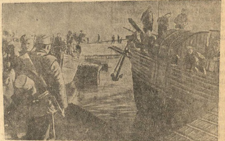
В Н-ском порту На снимке: Подразделение десантников перед отплытием на боевое задание.