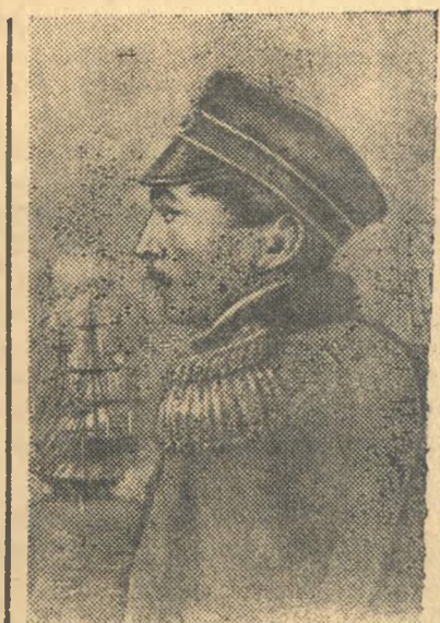
Адмирал Павел Степанович Нахимов

смелой боевой инициативы и воспитывал своих людей в духе беззаветной преданности Родине. Не даром его матросов называли „нахимовскими львами“.