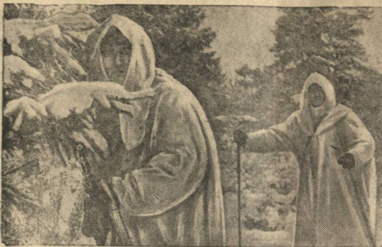
В лыжной разведке. (Н-ская часть Ленинградского военного округа).