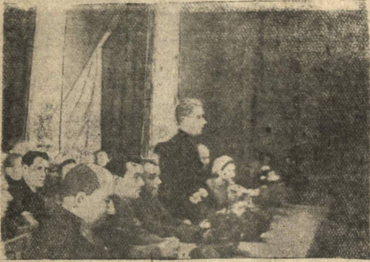
На снимке: президиум совещания.

9 января в г. Муроме состоялось окружное предвыборное совещание, посвященное выдвижению кандидата в депутаты Верховного Совета СССР.