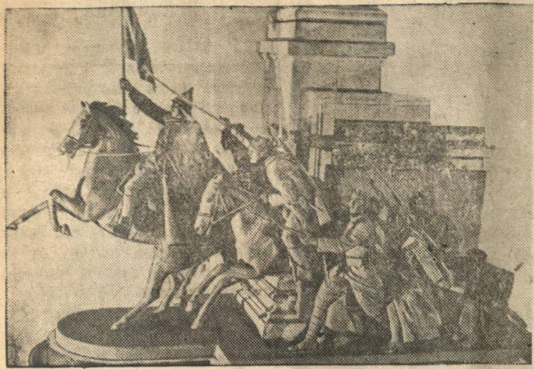
Фрагмент модели памятника работы скульптора С. Г. Королькова и архитектора В. В. Баранова.

В Ростове-на-Дону заложен памятник борцам за освобождение Ростова от белогвардейских банд. Памятник будет воздвигнут в текущем году.