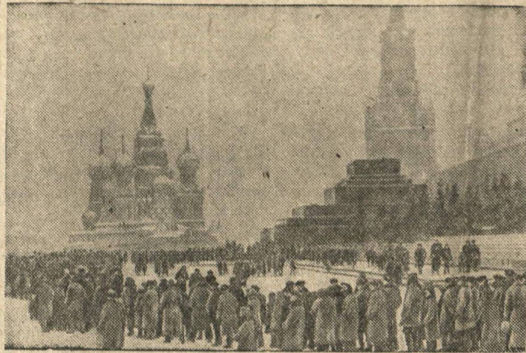
Трудящиеся у мавзолея Ленина.

Связисты Союза энергично готовятся к обслуживанию XVIII Всесоюзной конференции ВКП(б). Десятки отдаленных городов, не имеющих постоянной радиотелефонной связи с Москвой, на время работы конференции эту связь получают. Уже проведена проверка слышимости радиотелефона между Москвой и Красноводском, Чарджуу, Кустанасом, Ленинканом, Андижаном и другими городами. (ТАСС)