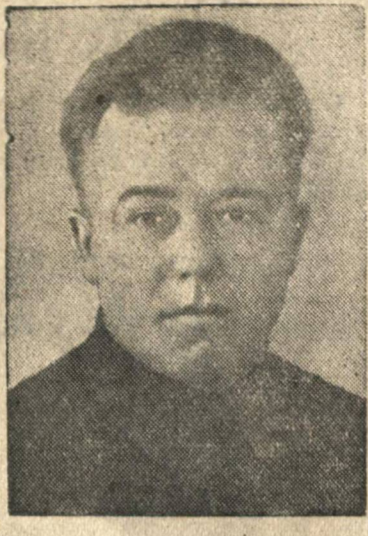
МИХАИЛ ИЗАНОВИЧ РОДИОНОВ , секретарь Горьковского обкома и горкома ВКП(б)—кандидат в депутаты Совета Союза Верховного Совета СССР по Горьковскому-Ленинскому избирательному округу № 118.