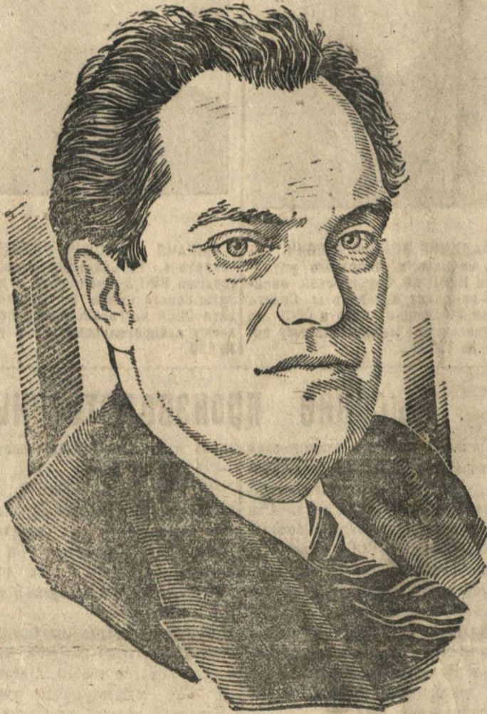
В. В. Куйбышев.

Сегодня исполняется 6 лет со дня смерти пламенного большевика, верного соратника Ленина и Сталина Валериана Владимировича Куйбышева, злодейски убитого троцкистско-бухаринской бандой врагов народа.