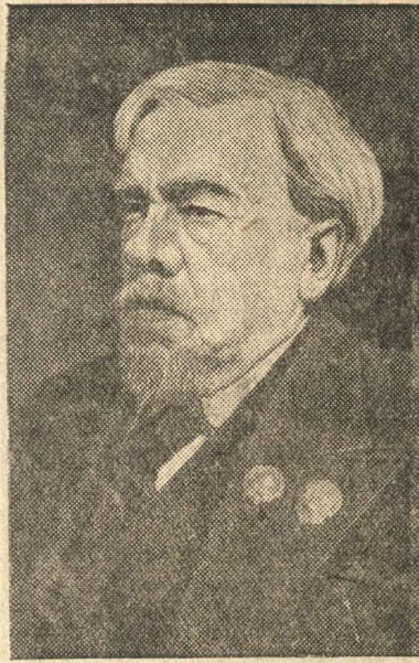
Герой Социалистического Труда академик Сергей Алексеевич Чаплыгин.

Все эти вопросы должны стоять в центре внимания партийных организаций советских учреждений. Отказавшись от механического перенесения методов работы производственных организаций, нужно направить все свои силы на политическое воспитание кадров советского аппарата, на укрепление государственной дисциплины, прививать каждому служащему высокие качества большевистского работника.