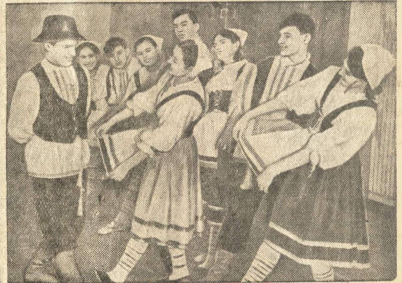
Молдавский танец в исполнении самодеятельного танцевального коллектива Рыбинского Дворца культуры ордена Ленина машиностроительного завода. Коллектив пользуется большой популярностью среди трудящихся Ярославской области.