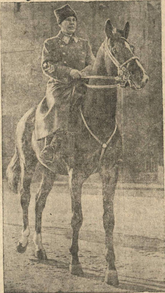
Народный Комиссар Обороны СССР, Герой и Маршал Советского Союза С. К. Тимошенко.

Центральный Комитет ВКП(б) и Совет Народных Комиссаров СССР, исходя из решений XVIII Съезда ВКП(б) поручил Госплану СССР приступить к составлению генерального хозяйственного плана СССР на 15 лет, рассчитанного на решение задачи — пережить главные капиталистические страны в производстве на душу населения — чугуна, стали, топлива, электроэнергии, машин и других средств производства и предметов потребления.