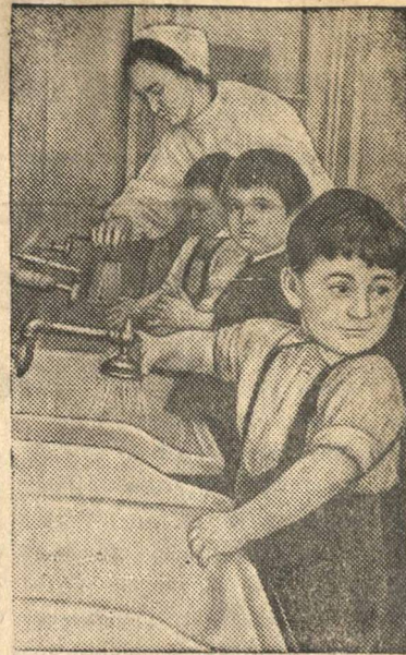
Утренний туалет в детских яслях № 2 металлургического завода имени Дзержинского (Днепродзержинск, УССР).