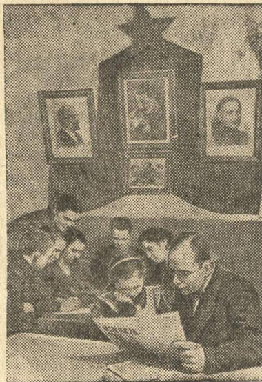
В Красном уголке.

Домовый комитет дома № 12 по ул. Яна Асара в г. Риге организовал Красный уголок, где жильцы дома проводят свои свободные вечера за чтением газет и книг.