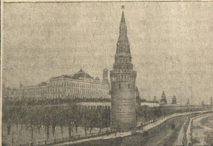
Кремлевская набережная и Большой Кремлевский дворец.