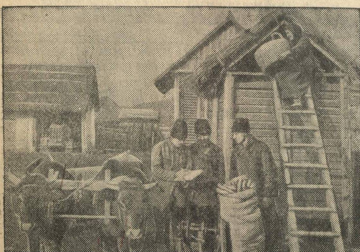
Колхозники колхоза им. Котовского привезли посевной материал.

В Бендерском уезде (Молдавская ССР) в этом году создано два новых колхоза. Колхозники деятельно готовятся к первой большевистской весне.