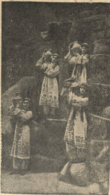
Сцена из 1-го акта музыкального представления „Дола“ в постановке Таджикского Государственного театра оперы и балета (Сталина бад).

В Восточной Африке, в Абиссинии, продолжаются бои. Возрастающая активность абиссинских партизан содействует преследованию англичанами отступающих итальянских частей. (ТАСС).