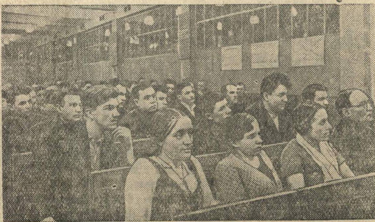
Партсобрание в литейном цехе № 3

Отчетно-выборные собрания цеховых партийных организаций на заводе имени Сталина (Москва).