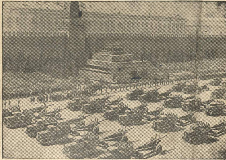
Парад войск на Красной площади. Артиллерия на параде.