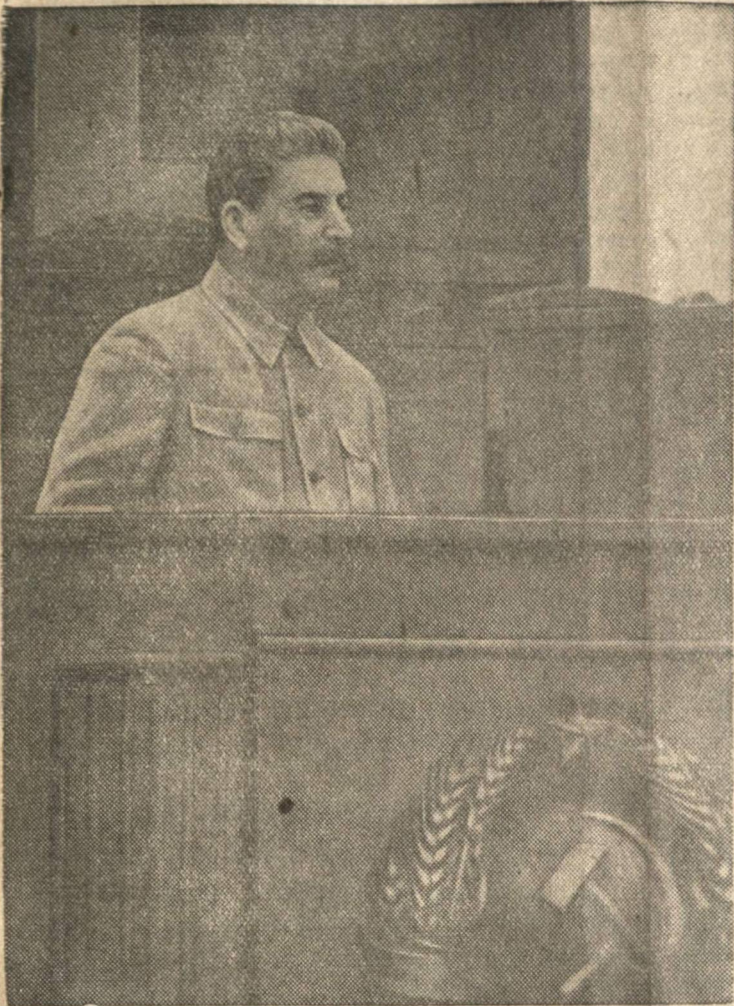
Выступление товарища И. В. Сталина на торжественном собрании, посвященном выпуску командиров, окончивших военные академии, состоявшемся в Большом Кремлевском дворце 5-го мая 1941 года.