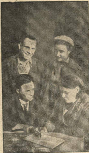
Подписка на билеты 15-ой лотереи Осоавиахима на первом государственном водителем завод имени Д. М. Казановича, в цехе мелких серий.