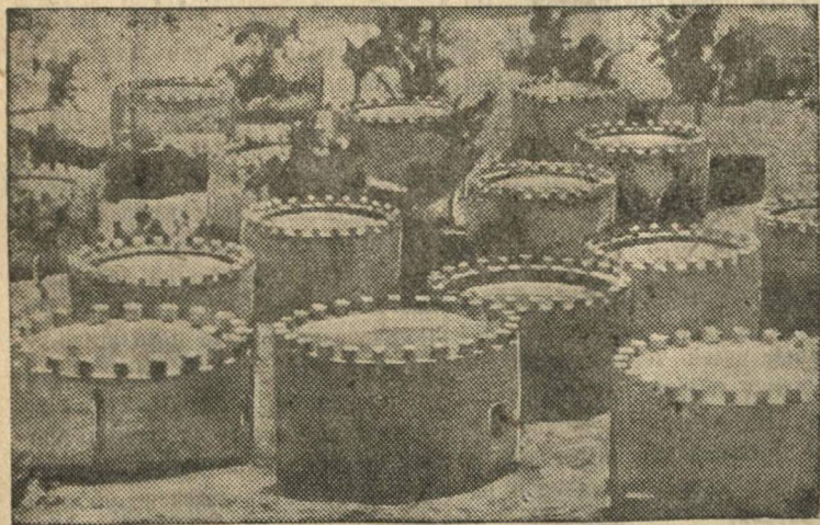
Жилаща туземцев в Аддис-Абебе (Абиссиния).

последовавшей 17 мая в 12 часов дня. Похороны состоятся 19 мая, в 5 часов вечера. Вынос тела с квартиры покойной. Улица Шмидта, дом № 19.