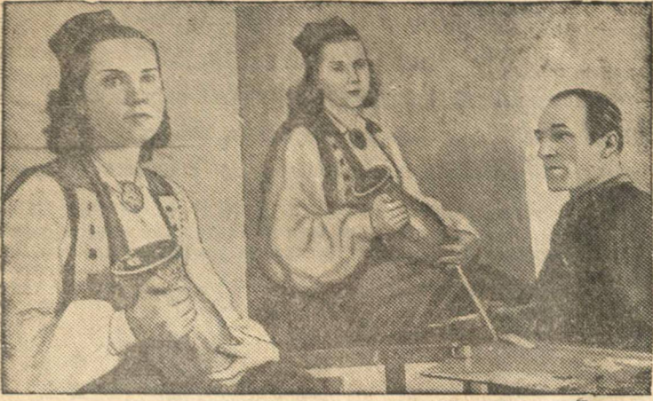
Сын крестьянина Гуго Язоби на занятиях по классу живописи.