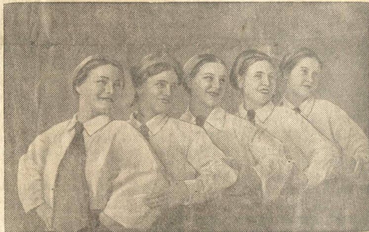
Экцентрический танец в исполнении балетного коллектива.