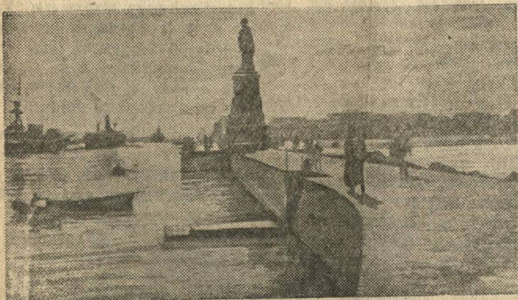
Порт Саид. Вход в Суэцкий канал.