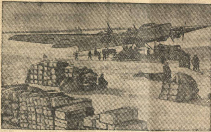
Погрузка рыбы на самолет для отправки в Архангельск.

В Нарьянмарском аэропорту (Немецкий национальный округ).