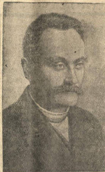
И. Я. Франко.