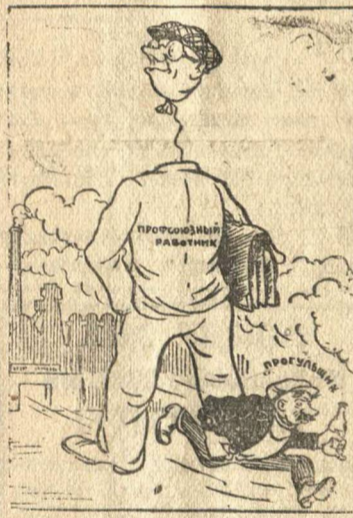
В роли наблюдателя. Рис. В. Лисевича.

Профсоюзная организация листопрокатного цеха до сих пор стоит в стороне от повседневного контроля за неуклонным проведением в жизнь Указа Президиума Верховного Совета СССР от 26 июня 1940 г.