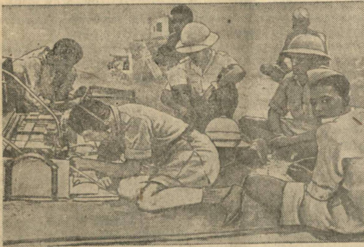
Полевая радиостанция абиссинских партизан.