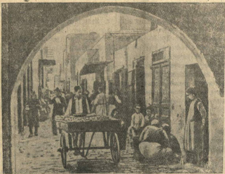
Туземный квартал в Триполи (главный город и порт в Ливии, Северная Африка).