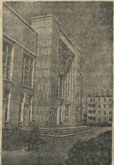
Новое здание кинотеатра в г. Караганде (Казахская ССР).