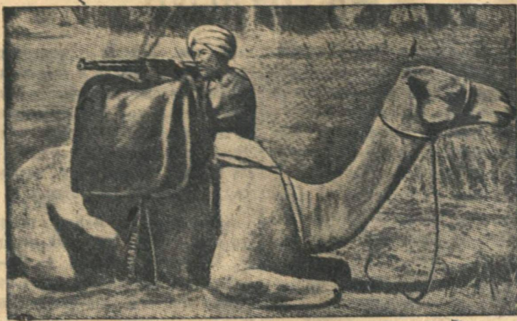
Верблюжий дозор суданских войск на эритрейской границе.