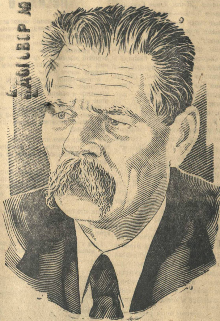
Алексей Максимович Горький Рисунок Г. Теодоровича.