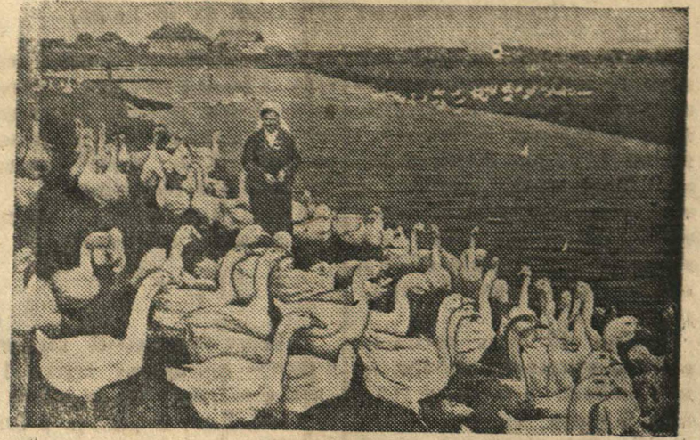
Гуси птицефермы на выпасе.

Колхоз „Колхозное село“ (Петрозаводский район, Дзержинской области) имеет богатую птицеферму, которая ежегодно приносит большой доход. Ферма имеет, включая молодняк, 1200 гусей, 350 уток и 2300 кур.