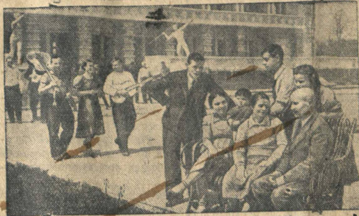
В доме отдыха ЦК союза металлургов Юга имени Орджоникидзе (Днепропетровская область) — отдыхают стахановцы металлургических заводов г. Днепропетровска.