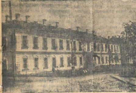
Здание металлургического техникума.