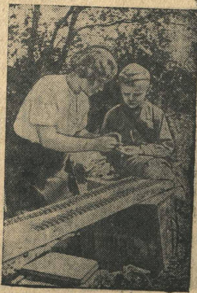
Боевые подруги командиров Н-ской части овладевают пулеметным делом. За подготовкой пулеметной ленты.