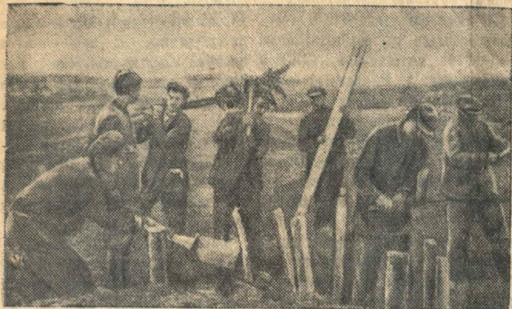
Колхозники строят противотанковые препятствия.

Население прифронтной полосы самоотверженно помогает бойцам Красной Армии в борьбе против фашистских захватчиков.