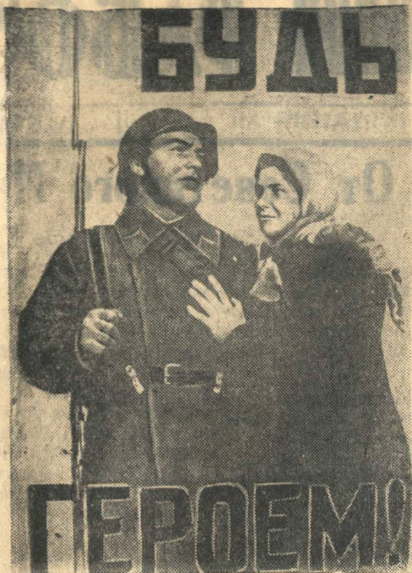
Фоторепродукция с плаката художника Б. Корецкого