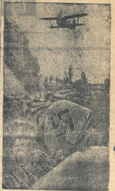
Славный советский сокол парит над сбитым им фашистским стержнем.