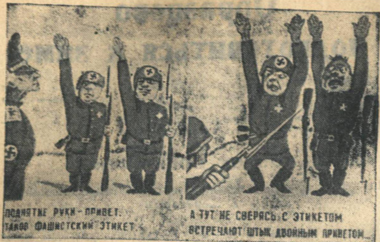
Рисунок Л. Осинского Текст литбригады „Окон ТАСС“ (Окно ТАСС № 90).