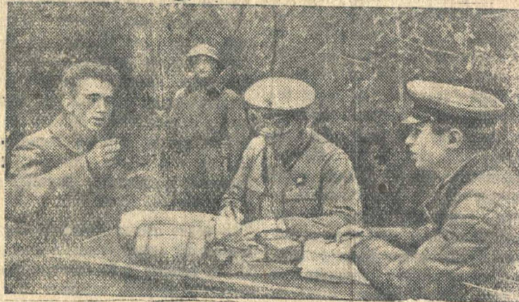
Допрос пленного немецкого солдата в штабе.