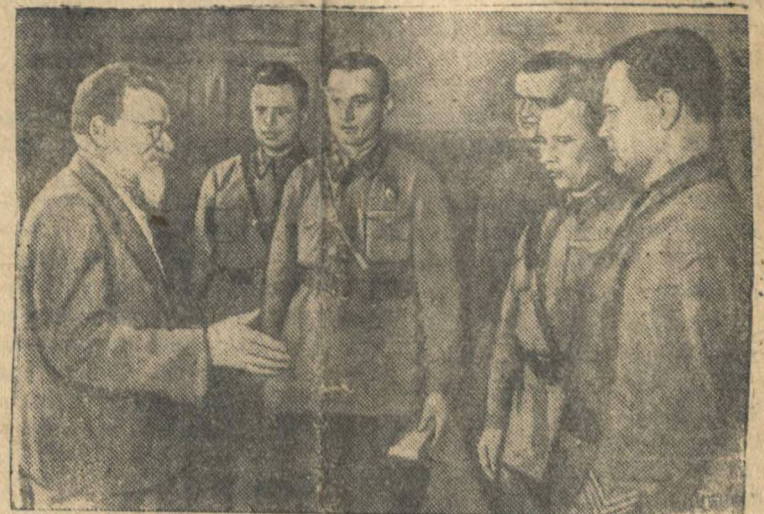
Товарищ М. И. Калинин беседует в Кремле с героями летчиками, награжденными орденами и медалями СССР за образцовое выполнение боевых заданий Командования на фронте борьбы с германским фашизмом и проявленные при этом доблесть и мужество.