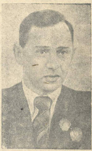
Герой Социалистического Труда И. М. Зальцман

За выдающиеся достижения в области организации серийного производства новых типов танков Президиум Верховного Совета СССР присвоил звание Героя Социалистического Труда Зальцману Исааку Моисеевичу — директору Кировского завода.