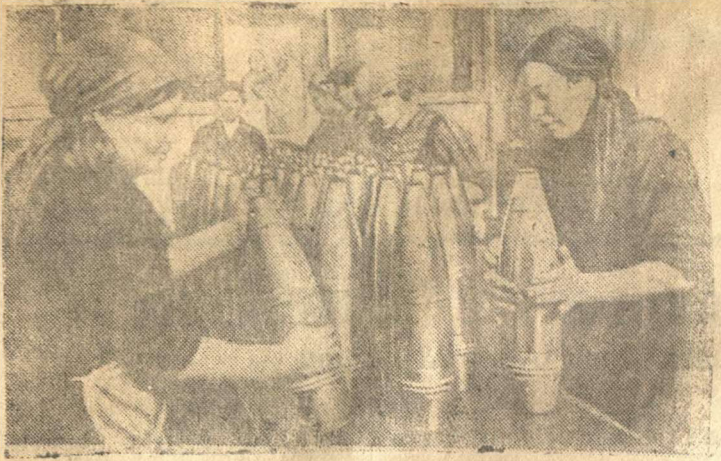
Коллектив Н-ского завода в одном из городов Поволжья во время войны быстро перестроил свою работу и начал выпускать разное вооружение для Красной Армии.