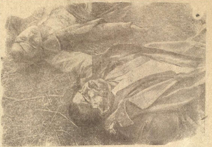
Трупы убитых, обнаруженные нашими бойцами при захвате села Генераловка.

Зверства немецко-фашистских оккупантов. В селе Генераловка Ростовской области гитлеровские бандиты замучили и убили 13 пленных красноармейцев.