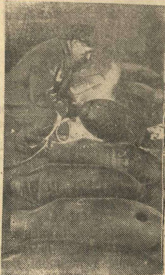
Отделка фугасных авиабомб на Н-ском заводе (Москва).