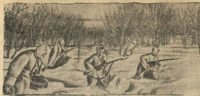
Бойцы капитана М. Яценко наступают на пункт Н.