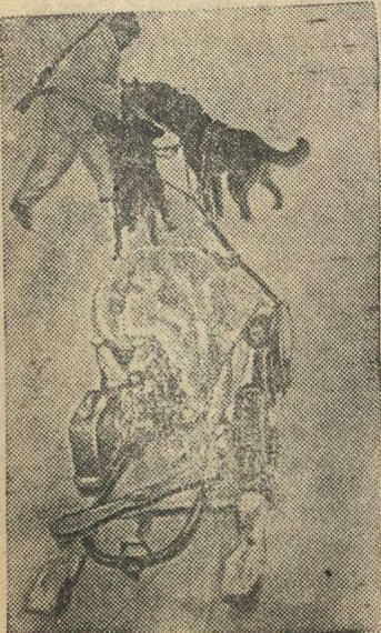
Транспортировка пулемета на ездовых собаках