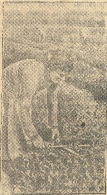
Тов. Тарба Дариго — стхановка колхоза имени Берия (Гулаутский район, Абхазская АССР) выполняет норму по формовке чайного куста на 250—300 проц.