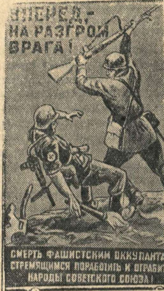
Плакат работы художника Д. Шмарина, выпущенный издательством «Искусство»