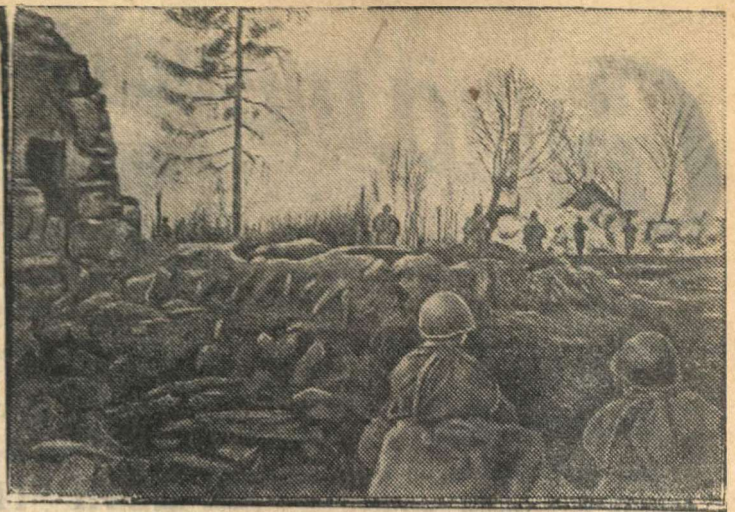
На снимке: бойцы атакуют населенный пункт М.