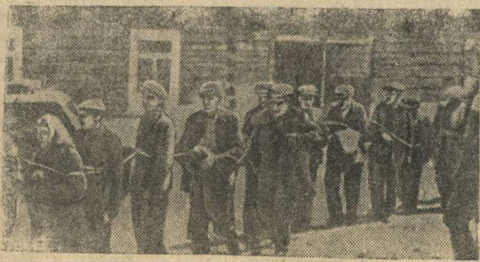
Ни в чем неповинных мирных советских людей немцы истребляют связывая веревками и гонят, как скот на убой. (Снимок взят у убитого немецкого солдата)

Немецко-фашистские мерзавцы разоряют белорусские города и истребляют их жителей. В начале сентября гестапо арестовало и заключило в тюрьму свыше 150 жителей города Брисва, Минской области, за то, что они не явились на работу по ремонту дорог. В числе арестованных было много истощенных от голода и больших женщин. 19 сентября банда эсэсовцев ворвалась в городскую тюрьму и учинила кровавую расправу над арестованными.