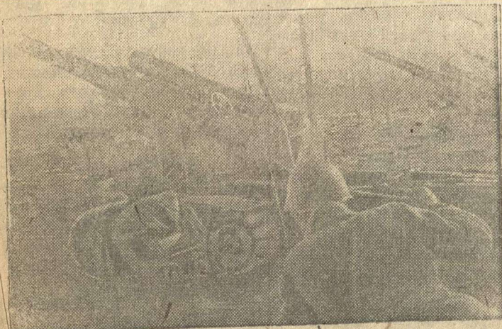
На снимке: Батарея советских дальнебойных орудий на огневой позиции.