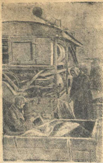
Очистка семенного материала к весеннему севу в колхозе имени Чкалова (Буранный район, Чкаловская область).

Пластинка имеет на оборотной стороне нарезанную шпильку с гайкой для прикрепления ордена к одежде.