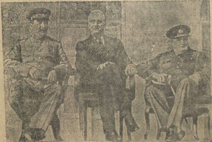
На снимке: Председатель Совета Народных Комиссаров Союза ССР тов. М. И. Калинин, Президент Соединенных Штатов Америки г-н Ф. Д. Рузвельт, Премьер-Министр Великобритании г-н У. Черчилль. (Снято в Тегеране по время Конференции руководителей трех союзных держав).

Председатель Президиума Верховного Совета СССР тов. М. И. Калинин вручил вчера, 30 декабря, орден Суворова I степени Маршалу Советского Союза И. В. Сталину, награжденному за правильное руководство операциями Красной Армии в Отечественной войне против немецких захватчиков и достигнутые успехи. (ТАСС)