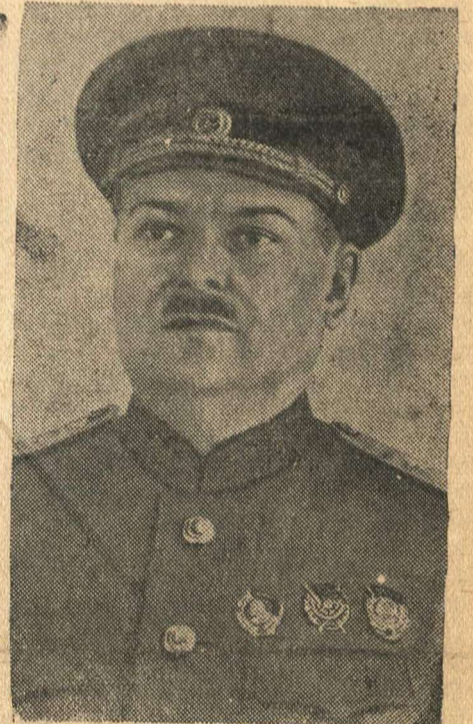
Генерал-лейтенант А.А. ЖДАНОВ, руководитель обороны Ленинграда

Восточнее Вияницы и севернее Христовки многочисленные атаки крупных сил танков и пехоты противника отражены с большими для него потерями. За время с 25 по 31 января наши войска на всех фронтах подбили и уничтожили 697 немецких танков. В воздушных боях и огнем зенитной артиллерии сбито 206 самолетов противника.