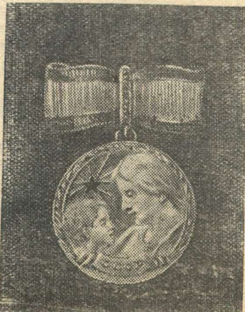
Орден «Мать Героиня» Орден «Материнская слава» I степени Медаль материнства I степени.