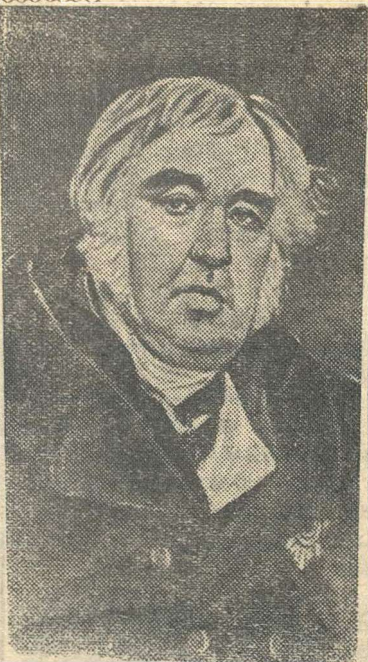
Иван Андреевич Крылов.

На этом совещании закончила свою работу.