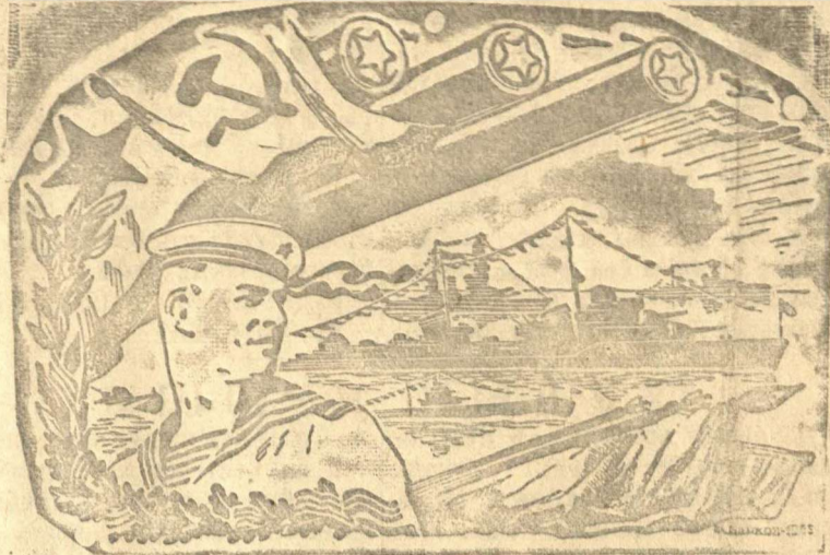
22 июля вся Советская страна праздновала День Военно-Морского Флота Союза СССР.

29 июля в 11 часов дня в районном Доме культуры созывается районное партийное собрание с повесткой дня: о мероприятиях по выполнению постановления СНК СССР и ЦК ВКП(б) «Об уборке урожая и заготовках сельскохозяйственных продуктов в 1945 году». Явка всех членов ВКП(б) и кандидатов в члены ВКП(б) обязательна.